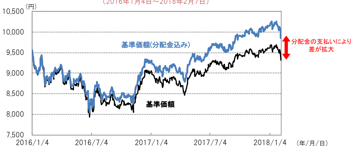
基準価額の推移 (2016年1月4日～2018年2月7日)

※上記グラフは、過去の実績を示したものであり、将来の成果を保証するものではありません。基準価額は信託報酬控除後のものです。 ※基準価額(分配金込み)は、税引前分配金を再投資(複利運用)したと仮定して、委託会社が算出したものです。 ※基準価額(分配金込み)は、2016年1月4日の値が基準価額と同一となるように指数化しています。