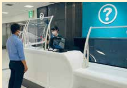
▲ご案内カウンター