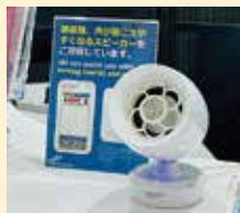
▲コミュニケーション