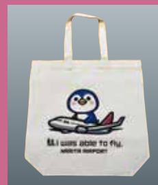
▲オリジナルトートバック ¥1,650(税込)

お店には豊富なトラベルアイテムからかわいい雑貨までたくさんの品々が売られています。なかでもおすすめはここでしか手に入らない成田エアポート限定デザインの品々。特にオリジナルキャラクターがデザインされたトートバックやステッカーは要チェックです。