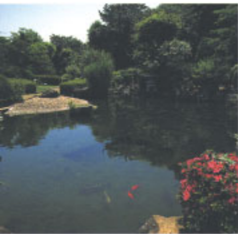
鯉の泳ぐ池を中心とした趣のある和風庭園

東京のベッドタウンとして著しく都市化された市川市ですが、梨の産地でもある北部地域には豊かな自然が残り、公園などの施設も集中しています。その一つが大野町にある市川市万葉植物園です。同市が定める「特色ある公園づくり」の一つとして1989年(平成元)に開園。同市は永井荷風や幸田露伴などの小説家や俳人、歌人とのゆかりの深い場所ですが、その文学の歴史をさかのぼれば『万葉集』に行き着きます。万葉集に詠まれた「真岡の手見奈」伝説が残る市川市にふさわしく、自然を受した万