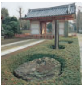
奈良時代の様子を模して建てられた下総国分寺の仁王門と当時の礎石(手前)※P4地図参照

で、その国府は現在の市川市国府台あたりでした。下総国分寺跡と下総国分尼寺跡が発見されています。