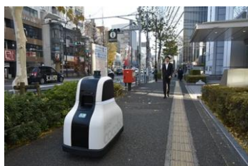
自律走行型警備ロボット cocobo の走行イメージ