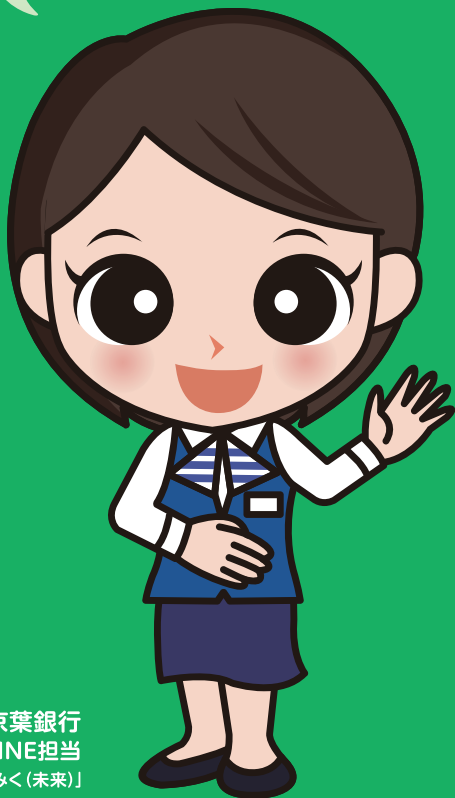
京葉銀行 LINE担当 「みく(未来)」