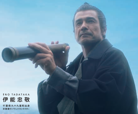
INO TADATAKA 伊能忠敬