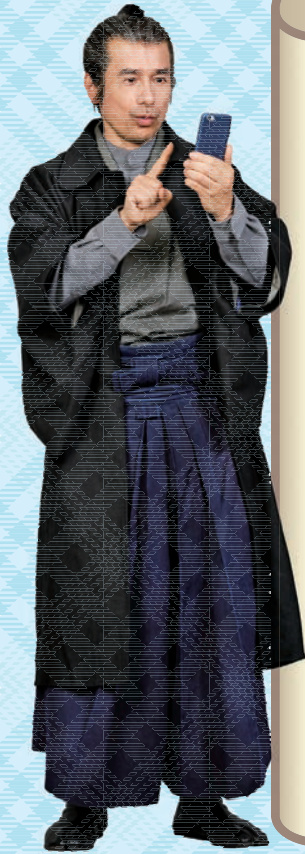
INO TADATAKA 伊能忠敬 千葉県九十九里町出身 京葉銀行ブランドキャラクター