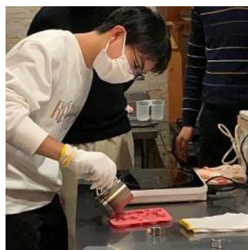
銅鏡鑄造・磨き体験