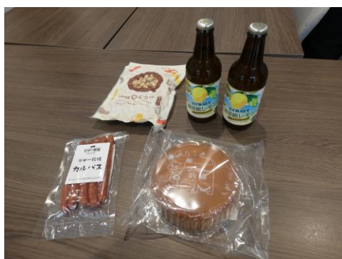
(内定者に贈った千葉県産の軽食と飲み物)