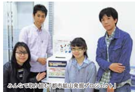
みんなで取り組む「都市鉱山発掘プロジェクト」