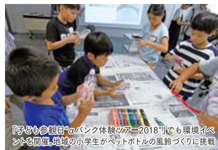
「子ども参観日」のバンク体験ツアー「2018」でも環境イベントを開催。地域の小学生がペットボトルの風鈴づくりに挑戦