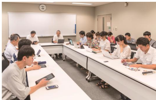
千葉大学環境ISO学生委員会の企画会議風景