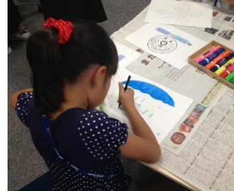
オリジナルうちわづくり