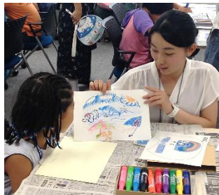
オリジナルうちわづくり