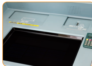
のぞき見防止フィルター

京葉銀行のATMは、正月三が日を除き、毎日朝8時から夜9時までご利用いただけます。 ※一部自動サービスコーナーでは異なる場合があります。