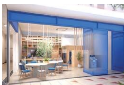
店舗イメージ図(ワズモール稲毛)

現役層を中心とした個人のお客さまのご相談ニーズにお応えするため、新たに「コンサルティングプラザ」を2カ所開設いたします。従来の窓口営業時間中にご来店できなかったお客さまでも、平日夕方や休日に専門のスタッフが対応します。また、商業施設や駅前のアクセス良好な場所に開設することで、多くのお客さまにご利用いただけます。