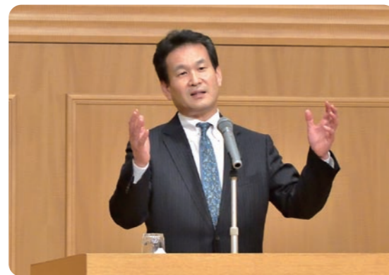
講師 辛坊 治郎 氏

ビジネスクラブ9月セミナーは、ニュースなどの解説でおなじみの辛坊 治郎氏をお迎えして京葉銀行文化プラザで開催されました。当日は、「情報が主役の時代—企業経営は情報が決め手—」のテーマで最近のニュースや自らの体験を例に、分かりやすくご説明いただきました。