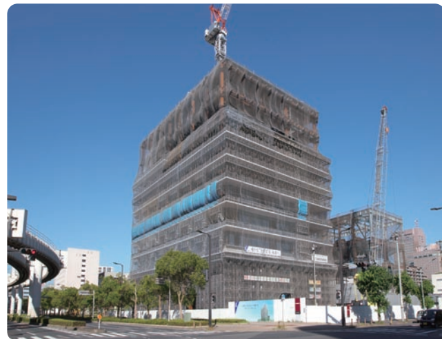
「千葉みなと本部」建設の様子（平成26年8月現在）