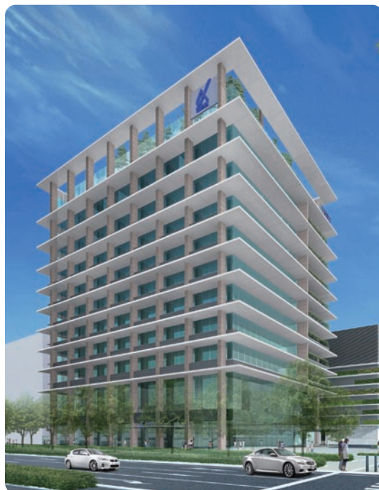
「千葉みなと本部」完成予想図（平成27年2月竣工予定）

現在当行は、平成27年2月の竣工を目指して、「千葉みなと本部」を建設中です。また、平成30年の稼働に向け、銀行の基幹システムである「次世代勘定系システム」の開発に着手しております。決済機能という重要な社会インフラを担う地域金融機関として、「千葉みなと本部」と「次世代勘定系システム」を中核に、今後も、お客様の安全性と利便性の向上に努めてまいります。