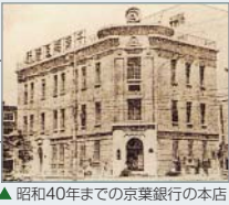
▲昭和40年までの京葉銀行の本店