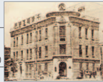
▲昭和40年までの京葉銀行の本店