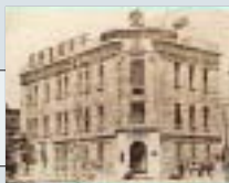
▲昭和40年までの京葉銀行の本店