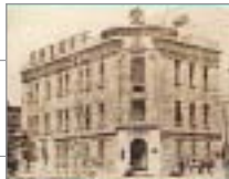
▲昭和40年までの京葉銀行の本店