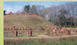
6世紀後半の古墳が復元されています

房総のむらに隣接する考古専門の博物館。県内の考古資料を展示する資料館をはじめ、埴輪が並べられた復元古墳(写真)や重要文化財の旧御子神家住宅と旧学習院初等科正堂など