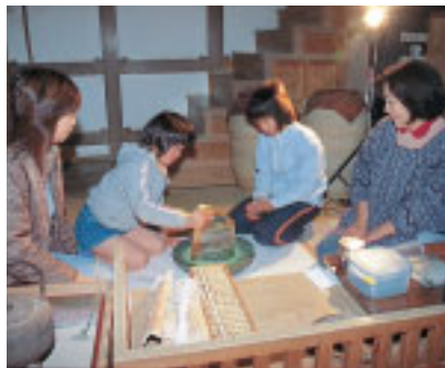
碾茶を茶臼で挽いて抹茶をつくります

紙、鍛冶屋では文鎮作り、小間物の店では組紐や手まり、瀬戸物の店では小皿の絵付けなどが体験で