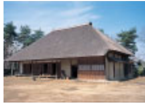
ぬれ縁が長い下総の農家

とができます。高い生け垣で囲まれた武家屋敷は佐倉藩の中級武士の住まいを再現したものです。