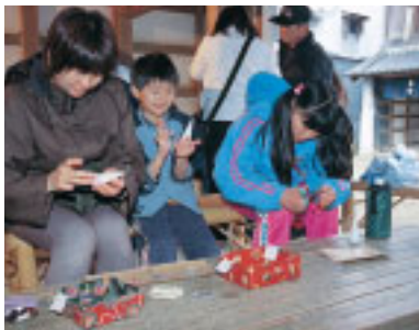
千代紙を切り抜いてろうそくに貼り、オリジナルろうそくを作ります

る町並みを参考にした、菓子の店、紙の店、鍛冶屋、小間物の店、瀬戸物の店などの商家が軒を連ねています。屋根に掲げられた看板、のれん、往来には驚電、大八車なども置かれにぎやかな雰囲気です。菓子の店では菓子作りや煎餅焼き、紙の店では折り