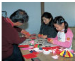
千代紙に挑戦。何ができるのかな？

紙、鍛冶屋では文鎮作り、小間物の店では組紐や手まり、瀬戸物の店では小皿の絵付けなどが体験で