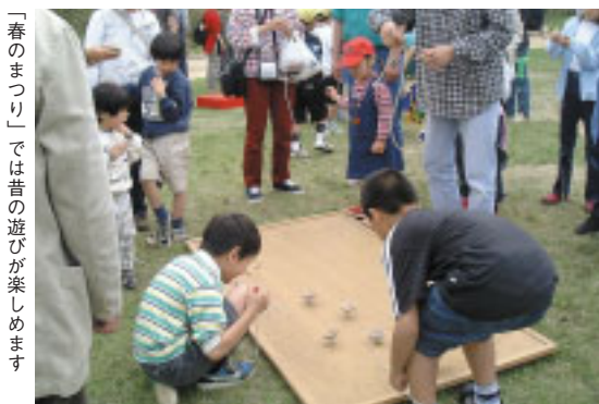
「春のまつり」では昔の遊びが楽しめます