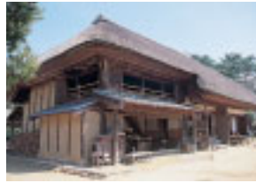
中二階がある上総の農家