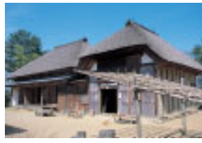
別棟造りの安房の農家