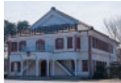
房総のむら管理棟