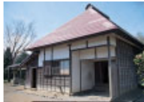
武家屋敷の玄間口