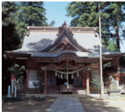
杉の大木に囲まれ厳かな雰囲気の本殿

いる山倉大神本殿は、安永7年(1778)の建立で間口、奥行ともに4.5mの木造銅板葺一間流れ造です。境内にはほかに神楽殿、御輿殿などがあります。戦前の初卯祭は関東一円に組織された「山倉講」の参詣で隆盛をきわめました。神社に残る奉納額や絵馬などは東京や横浜の団体からのものが数多く見られ、その名残りをとどめています。