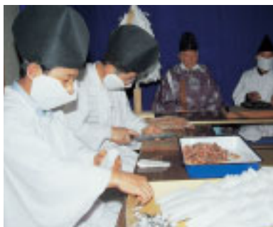
祭りの前日に準備されるサケの護符。病や災いをサケる避けるといわれます

鮭祭りは山倉大神の氏子11組のうちの2組が交代で当番を務めます。総行司や猿田彦、魚類勝手といったさまざまな役で100人近くが参加します。祭りの前日(宵祭)は魚類勝手の5人が鮭の護符を作ります。護符は塩漬けにした鮭の切り身と、黒焼きにした鮭を粉末にしたものです。特に風邪に効果があるとされ、祭りの当日は護符を求める参詣客で境内にはぎわいます。