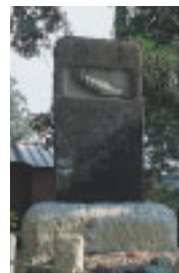
境内にある鮭の浮き彫りの奉納碑

いる山倉大神本殿は、安永7年(1778)の建立で間口、奥行ともに4.5mの木造銅板葺一間流れ造です。境内にはほかに神楽殿、御輿殿などがあります。戦前の初卯祭は関東一円に組織された「山倉講」の参詣で隆盛をきわめました。神社に残る奉納額や絵馬などは東京や横浜の団体からのものが数多く見られ、その名残りをとどめています。