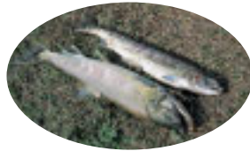
栗山川漁協によるサケの採捕作業。繁殖期のサケの体には赤黄色の斑紋が現れます

サケは北太平洋を数千キロも回遊し、非常に高い確率でふ化したときの川に戻ることが証明されています。この不思議