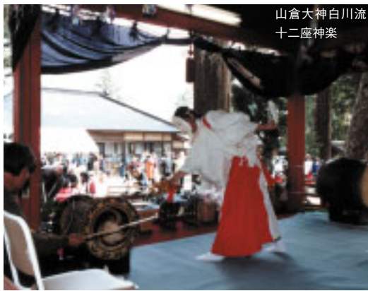
山倉大神白川流十二座神楽

毎年4月の第1日曜日に山倉大神白川流十二座神楽(町指定無形文化財)が山倉芸能保存会によって奉納されます。旭市鎌数の