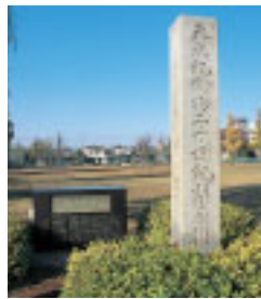
二十世紀梨原樹碑(松戸市)

世紀なしの原樹は天然記念物に指定されていますが1947年(昭和22)に枯れてしまい、記念碑が立てられています。