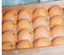
選果式に出されたよりすぐりのびわ

天皇・皇后陛下や皇太子・同妃殿下に献上される房州びわの選果式が毎年6月中旬に行われます。安房郡市の各びわ組合の自信作が一堂に会し、育成のプロたちがその“容姿”を厳正に選考。杉の化粧箱に入れて県知事の名で献上されます。