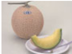
JA長生ながいきメロン

マスクメロンの美しいネット(網目)は、生長の過程で表皮の生育が止まって起きるひび割れをふさごうとする組織が発達し、盛り上がってくるためにできます。ネットの太さと密度のバランスが味に大きく影響します。