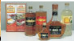
工場見学のお問い合わせは白井梨ブランデー株式会社まで ☎047-497-1477 月曜日休 http://www.qazcity.com/siroi/

ても手間のかかる作業です。農家の人手不足を補うため市原市農業協同組合では一般から梨ボランティアを募集。2年間の実習を終えて今年から活躍しています。受粉に使われる、先に羽毛のついた棒を「凡天」と言います。同じ品種の花粉では結実しないため、それぞれの品種に合った品種の花粉をつけます。幸水の場合は5月上旬から6月中旬にかけて段階的に摘果を行い、大きく良い実を残します。8月上旬から9月上旬には赤褐色に色づいた実が収穫され、規格ごとに分けて出荷されます。