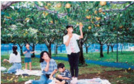
主要産地の一つ、鎌ヶ谷市内にある観光農園

品種別にみると、多く作られている順に幸水、豊水、新高、二十世紀、長十郎、新水です。幸水は県全体の結果樹面積の約半