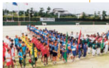
全日本学生ソフトテニス大会

全国的に有名なテニスの町で、大学生や中・高校生たちの宿舎がさかん。460面のコート数は1市町村としては日本一。2005年のインターハイ、2010年の国体ソフトテニス会場の予定地。