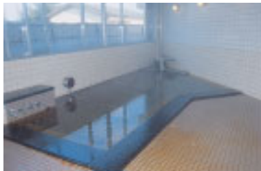
白子温泉 アクア健康センター内にある

温泉の基準は「温泉法」で定められています。地下水の湧き出る温度が25度以上である場合は無条件に、また25度未満であっても指定された19種類のガスやイオンなどの物質のうち、いずれか1つ以上で基準値以上の量を含んでいれば「温泉」といえます。