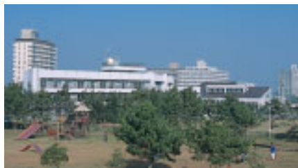
下/リゾートマンションが立ち並ぶ白子町の海岸付近。手前右が同センター、隣は国民宿舎白子荘

備えた「アクア健康センター」となってリニューアルオープンしました。10年間で入場者数は80万人を突破し、専門家による健康相談室の開設など、憩いと健康の拠点となっています。