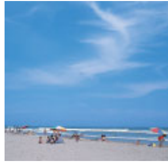
同センターの目の前は広々とした白子海岸。海水浴シーズンはもちろん、風を求めてスカイスポーツを楽しむ人たちが年間を通して集います

備えた「アクア健康センター」となってリニューアルオープンしました。10年間で入場者数は80万人を突破し、専門家による健康相談室の開設など、憩いと健康の拠点となっています。