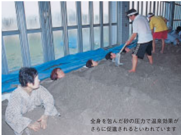
全身を包んだ砂の圧力で温泉効果がさらに促進されるといわれています

九十九里地方南部、白子町にある白子町アクア健康センターでは天然ガスを利用した人工の砂風呂が体験できます。浅く掘った砂の上に浴衣一枚になって仰向けに横たわり、肩からつま先まですき間なく砂をかけてもらい、静かに温まります。湿った砂の表面温度は約45度で、初心者の場合は約10分、慣れた人でも約20分程度を目安に入ります。スコップを手にしたスタッフが砂に空気を入れて温度を下げたり、もっと熱い砂を加えたりして温度を調節します。