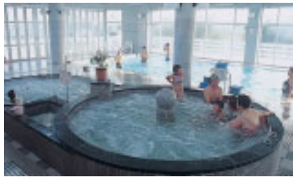
上/お湯の熱に加え、水圧で温熱効果が高まる渦浴(手前)と温水プール

砂風呂が開設されました。町が夏期型観光地から通年型観光地へと変わっていく中で、観光客や地元住民の保養と健康づくりの場を目指して、1990年、多種類のお風呂や温水プール、トレーニング室なども兼ね