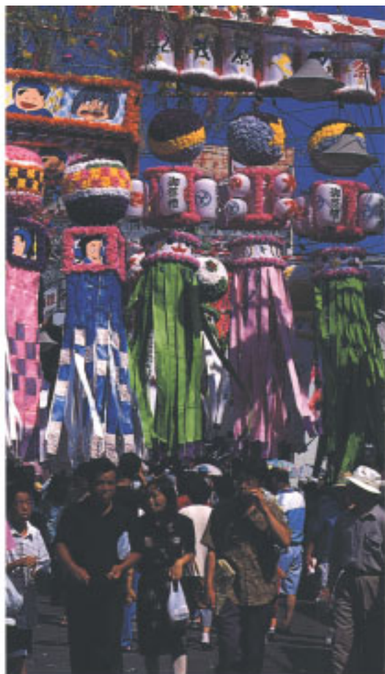
中心街の豪華な七夕祭り