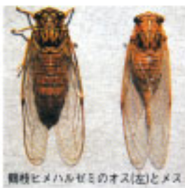
鶴枝ヒメハルゼミのオス(左)とメス

八幡山と呼び丘陵地がその発生地で国の天然記念物に指定。体長は約27mmくらいで、わが国のセミの中では最小とい