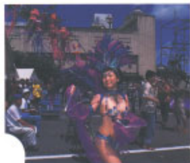
特別出演の浅草サンバ

ホームページ http://www.moriguchi-ccl.or.jp/kanko