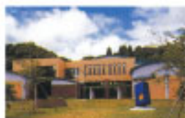
茂原市立美術館・郷土資料館

交通 ◆JR茂原駅からバス7分「藻原寺」下車徒歩5分 (茂原市立美術館・郷土資料館)