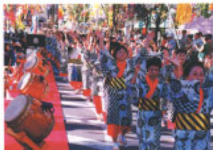
婦人会による華麗な茂原祭り

日本三大七夕の一つ、茂原七夕まつりは今年で46回目。昭和29年7月、商店街の活気を取り戻すため市内樓町通りで開かれたの