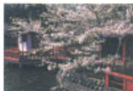
2,600本の桜が咲き誇る茂原公園

す。遊歩道をはじめ、展望台、グリーントリム、芝生広場などのほか、茂原市立美術館・郷土資料館もあり、郷土ゆかりの作家の絵画や書、市の考古・民俗・歴史資料などを展示しています。