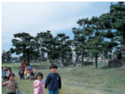
復元された見染の松