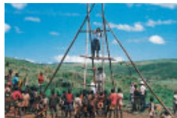
現地で用具を揃え、上総掘りの原形を生かした井戸掘り(ルワンダ)

江戸時代末期、上総地方に伝わった井戸掘りの技術が独自に発展し、明治時代に確立したのが上総掘りです。電力を必要とせず用具も安く済むことから全国に急速に普及しました。現在、その技術体系は東南アジアやアフリカの開発途