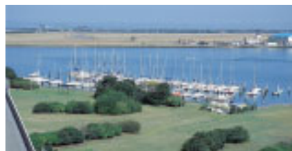
中の島大橋から見下ろす中の島公園内のヨットハーバー。東京湾アクアライン(左上)も遠望できます

木更津港のシンボル・中の島大橋が特に注目を浴びたのは1987年。大ヒットしたテレビドラマ「男女7人秋物語」(TBS系)で、主人公の今井良介(明石家さんま)が木更津から川崎までカーフェリーで通勤していたことから、フェリーが通過する大橋付近はたちまち若者のデートスポットになりました。