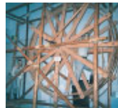
上総掘りの平足場の模型

木更津市太田山公園内の県立上総博物館には上総掘りの工法模型や用具(国指定重要有形民俗文化財)が展示されています。交通■JR木更津駅から徒歩約20分 ●企画展「浮世絵にみる自然とくらし」～5月20日まで