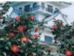
城山公園のツバキ