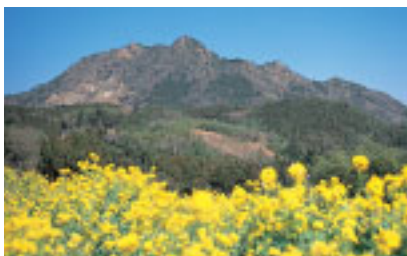
伊予ヶ岳とナノハナ