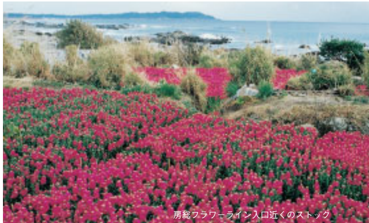
房総フラワーライン入口近くのストック