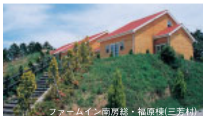
ファームイン南房総・福原棟(三芳村)

農村に滞在して農業体験やアウトドアを楽しむ「グリーンツーリズム」が南房総を中心に盛んになってきています。滞在施設の整備も進んでいます。また千葉県県のホームページでは県内21カ所の都市農村交流施設を紹介しています。 http://www.agri.pref.chiba.jp/