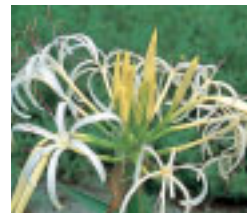
ハマオモト(ヒガシバナ科)の開花は6月~9月

花作りは平地だけでなく海に面した南向きの段々畑でも見られます。強い潮風を防ぐ生垣で花を囲んだり、山のふもとから上へと寒さに弱い花の順に植えつけるなど多くの工夫がなされています。地理的条件と長年積み重ねられた栽培技術が一大花産地を誕生させました。