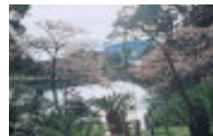
抱湖園のカワツザクラ