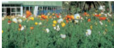
白浜フラワーパークのポピー