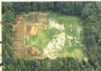
御茶屋御殿跡(1995年の発掘調査時)