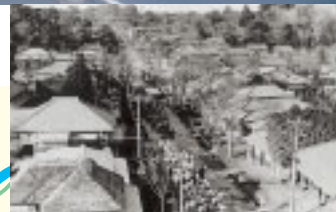
年(上から)現在の玉屋付近と昭和13