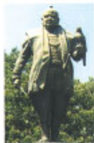
鷹がリスタイルの家康像(駿府城跡)

船橋から東金までほぼ一直線に延びる古街道。これが徳川家康が東金で鷹がりをするために佐倉藩主で老中であつた土井利勝に命じて造らせたという御成街道です。鷹がりを好んだ家康は江戸周辺