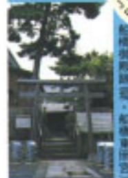
船橋御殿跡・船橋御成道