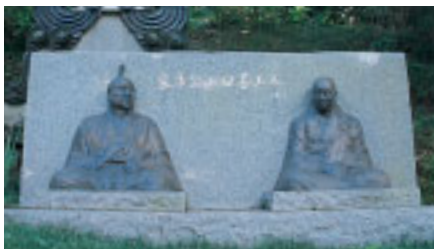
家康(左)に拝謁する最福寺七世住職・日善上人(東金市最福寺)

御成街道を通過って家康は2回鷹がりに来ています。2回目は1615年(元和元)の冬で、数人の側室や腰元を連れていました。翌年春、家康は74歳で死去しています。二代将軍秀忠は8回訪れ、1630年の記録では、鷹匠、鳥見役人、御弓鉄砲頭、書院番、旗本など総勢522人の大行列で、周辺の大名を威圧しました。三代将軍家光は大納言の時に1度来ています。その後は五代将軍綱吉の時代に鷹がりに禁止令が出され、将軍の御成りはなく、御成街道は九十九里方面への物資輸送や生活路としての性格を強め、宿場もできました。