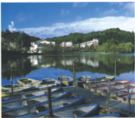
東金御殿跡・県立東金高校と御殿山