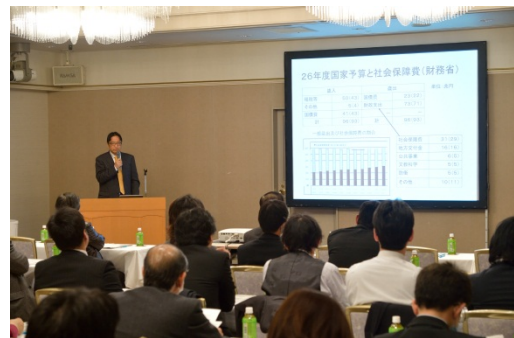
■経営戦略セミナー